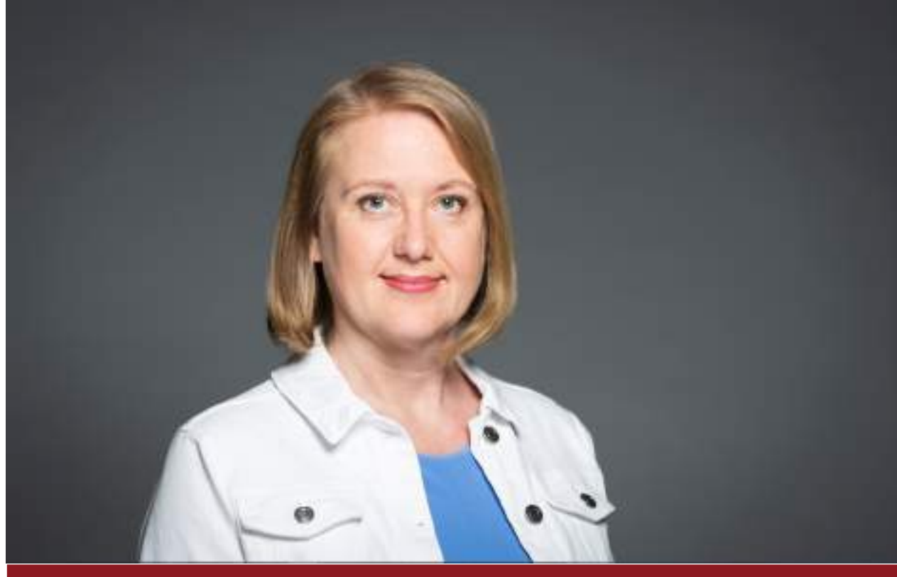
Lisa Paus, Bundesministerin für Familie, Senioren, Frauen und Jugend, MdB, Schirmherrin für das audit berufundfamilie / audit familiengerechte hochschule

Bundesministerium für Familie, Senioren, Frauen und Jugend