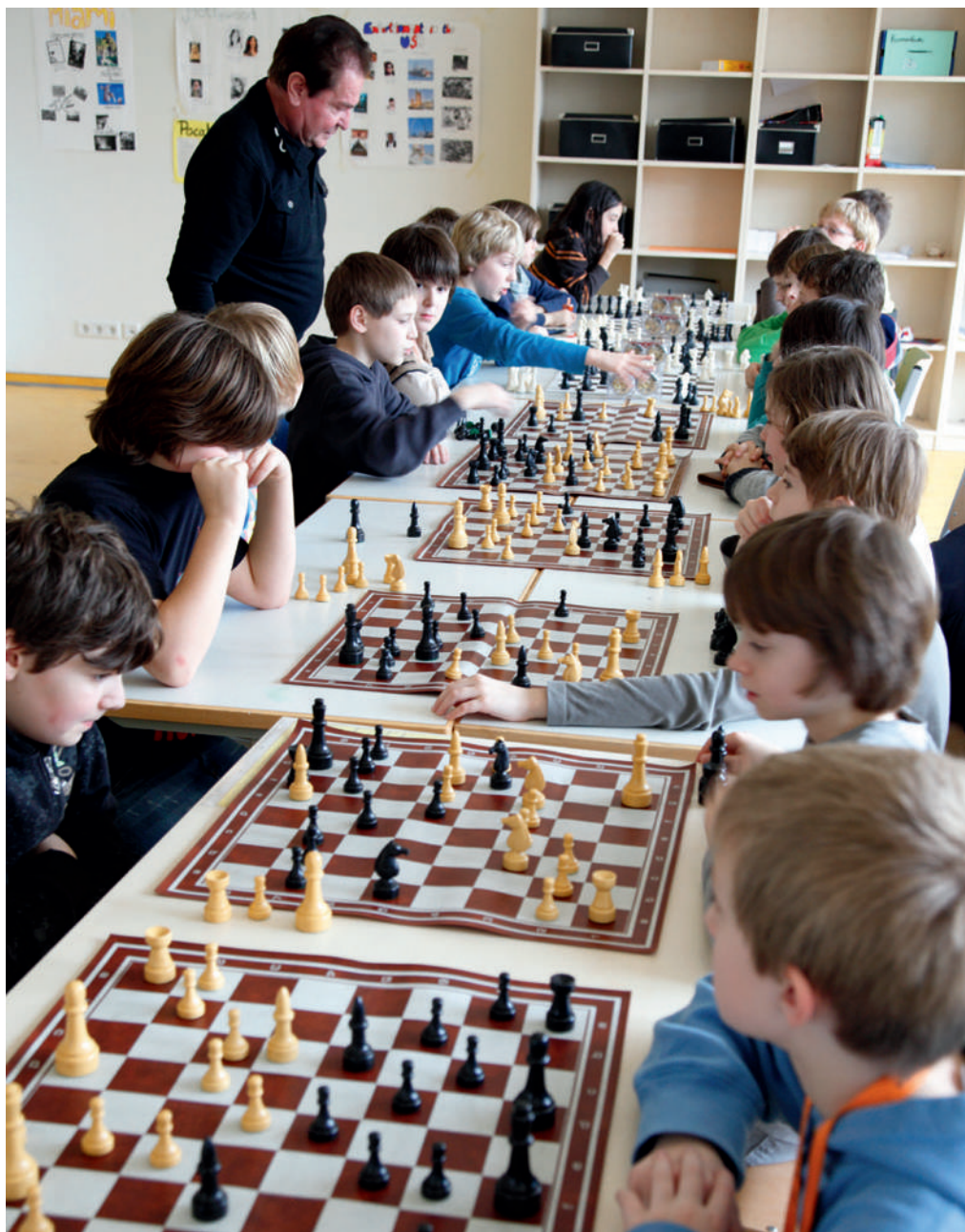
Ein Thema der Schulkonferenz: Die Einrichtung von Ganztags- und Betreuungsangeboten